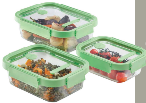
SET RECIPIENTES LEKUE 34,90€