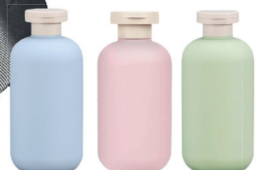
BOTES RELLENABLES AMAZON