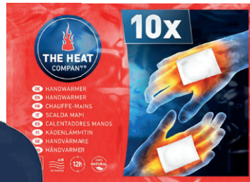
CALIENTA BOLSILLOS 12,50€