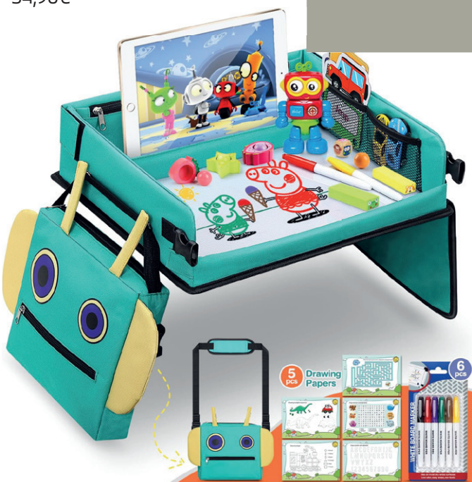
MESA JUEGOS VIAJE 32,95€ AMAZON