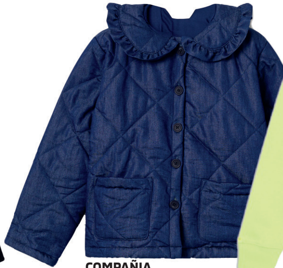
COMPAÑIA FANTÁSTICA MINI