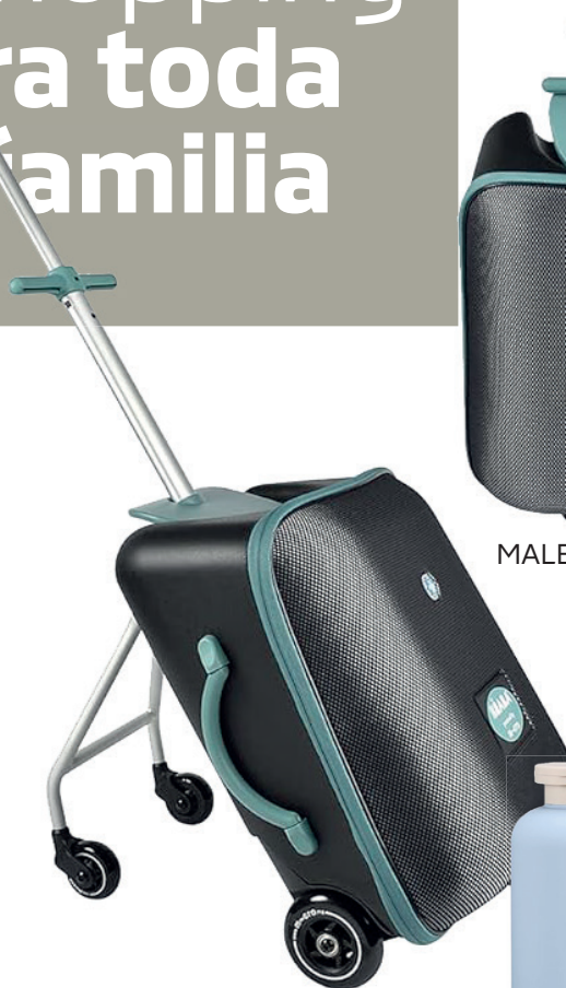
MALETA CABINA CON ASIENTO NIÑOS BEABA 195€